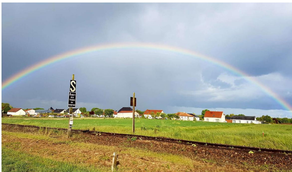
Arc-en-ciel sur notre village

Directeur de publication : Pascal VANSANTBERGHE Imprimé par nos soins