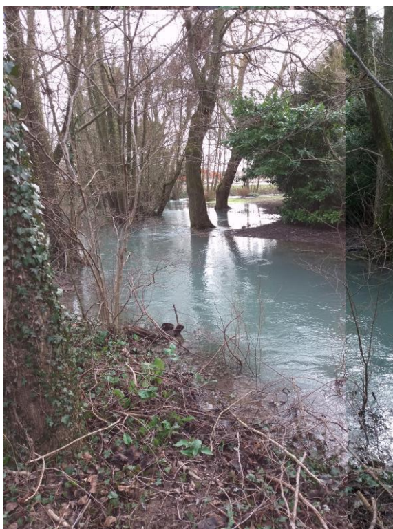
Rayon de soleil sur la Coole (en crue)