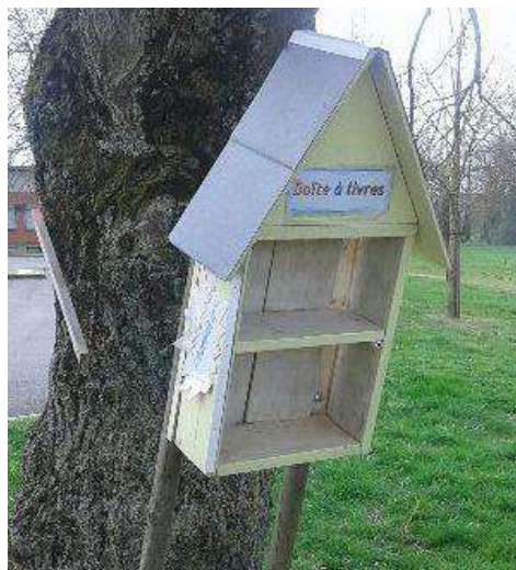
La boîte à livres, porte arrachée, sa structure détériorée

Alors que les associations et les employés municipaux s'emploient à rendre votre environnement attractif, des dégradations et incivilités mettent à mal leurs efforts. Dernièrement c'est la boîte à livres installée espace Jean Pol Daumont qui a subi la bêtise de certains. Nous appelons tous les habitants à nous aider pour préserver la quiétude et la qualité de vie de notre village.