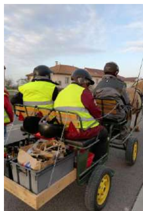
Ramassage des verres