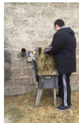
Nourriture des animaux