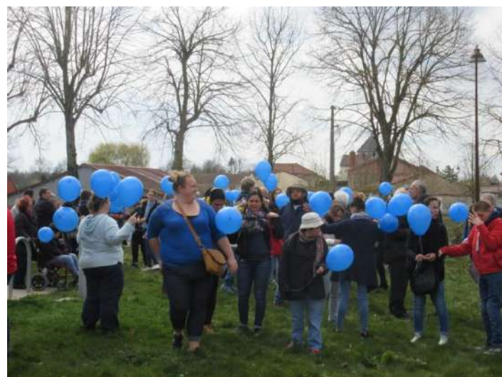
Lâcher de ballons à Nuisement, lors de la journée mondiale de l'autisme