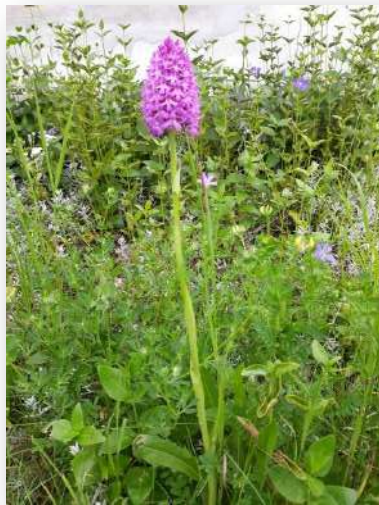
Orchidée sauvage de notre village