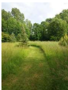
Tontes différenciées qui laissent accessibles les espaces verts

La gestion différenciée des espaces est maintenant visible. Elle contribue à faire revenir la faune, notamment les insectes, mais aussi la flore. Des espèces rares reviennent sur notre commune comme les orchidées sauvages.