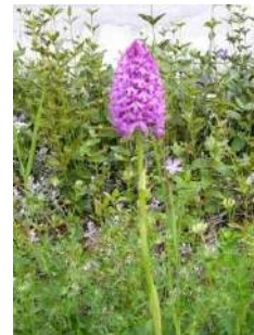
Orchidée sauvage (Anacamptis pyramidalis)