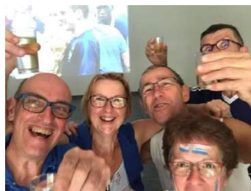
L'événement a été arrosé (avec modération) par les nombreux supporters.

Les encouragements ont fusé lors de ces retransmissions, pour laisser place à une explosion de joie au coup de sifflet final le 15 juillet.