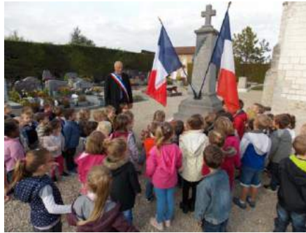
Les enfants attentifs aux explications de M. le Maire qui, pour rendre plus solennel ce moment, portait son écharpe tricolore.

Avec des mots simples, M. le Maire et les enseignantes ont expliqué pourquoi le devoir de mémoire était important, mais aussi pourquoi cela ne devait plus se reproduire. Les nombreuses questions des enfants, mais aussi leurs réflexions, ont démontré leur intérêt et leur sensibilisation sur le sujet.