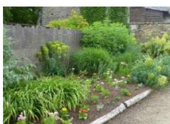
Paillage organique au pied de massif