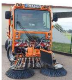
Balayeuse-désherbeuse de voiries

Des méthodes préventives et curatives diverses existent pour atteindre ces objectifs. On peut citer par exemple le désherbage mécanique avec notamment le balayage des rues ou encore le désherbage thermique. Les méthodes préventives sont également efficaces, comme la mise en place de paillage au pied des massifs et l'utilisation de plantes couvre-sol.